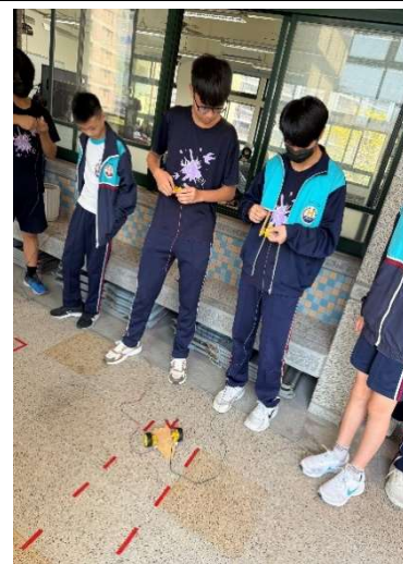
~碧風揚起共創學習~

巡堂路過生科教室，看見老師正在課程驗收與評量；經過幾堂課的組裝、造型與測試，同學們必須倆倆合作一起操控組裝車在規定的時間內完成「路考」~壓線扣分、超時扣分。佇足停留觀看片刻，聽聞慘叫聲此起彼落...老師跟同學說要不要先去旁邊再練習一下...我往旁邊看去，已經有好多組的「要不要」在那邊練習了。沒錯，理論與實務總是還有一段距離的；課堂上，老師講解的清楚，同學們聽的也是明白；但，到了真正評量的時刻，得靠自己面對考題時，才是確認會不會的關鍵時刻。看來，各種學習領域，實際的多多練習絕對是王道~坐而言不如起而行。