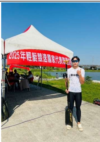
~放對位置都是人才~ ~碧風揚起共創學習~