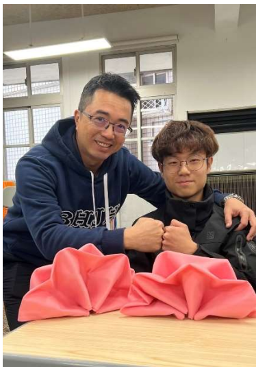
~碧風揚起共創學習~