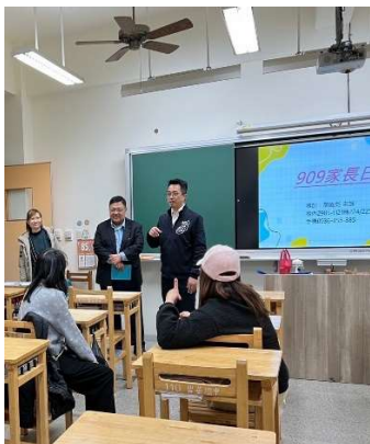
~碧風揚起共創學習~