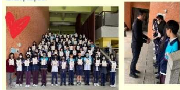
~碧風揚起共創學習~