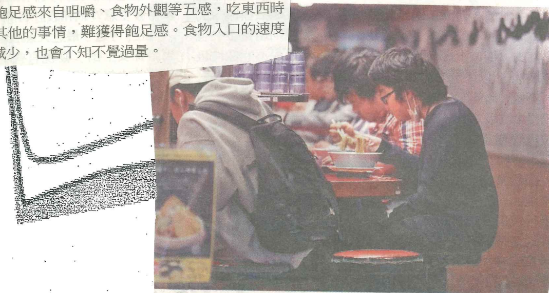
店倡「吃拉麵禁滑手機」, 引發熱議。圖為東京拉麵店。