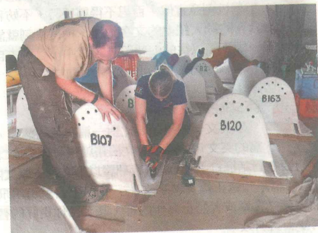
工作人員協助打造人工企鵝巢穴。

這些小屋子其實是人工的企鵝巢穴,結構,內部採雙層設計,搭配可反射陽光的白色陶瓷建材維持室內溫度在攝氏35度以下,有利企鵝避暑與孵蛋。