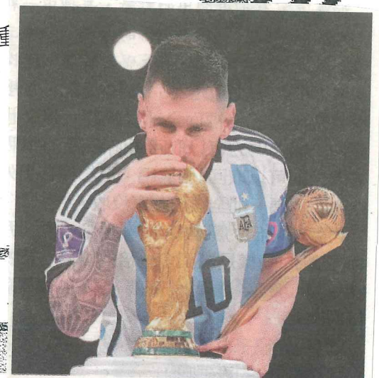
梅西曾說, 只想將世界盃冠軍獎座帶回阿根廷。