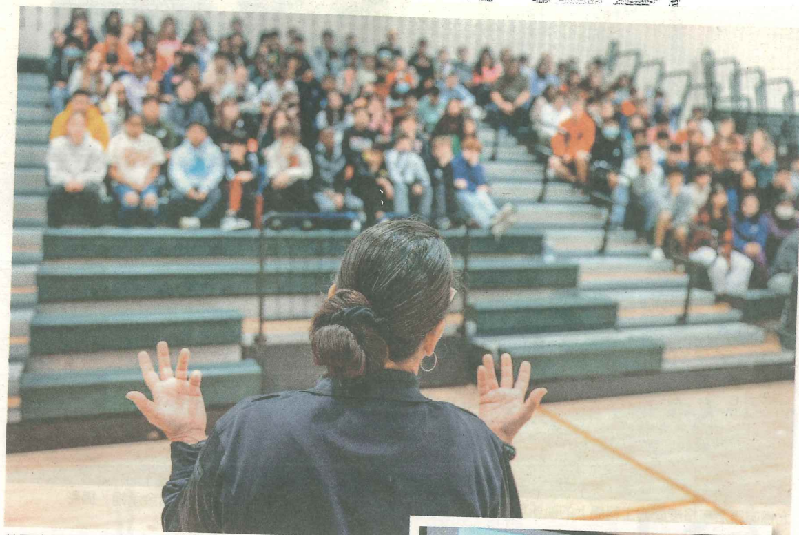
美國康乃狄克州斯坦福市一所中學集合所有8年級學生,由女警官教導網路安全問題。

校方說,是學校主動邀請斯坦福警察局協助派人演講。警局也表示,他們除了犯罪防治工作,近年尤其著重社區外展計劃,負責的警官一直在向全市學生說明網路問題。