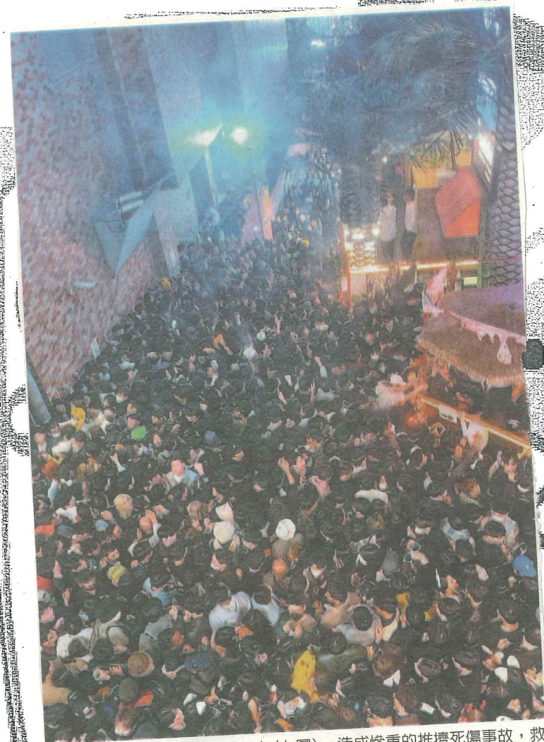
南韓梨泰院狹小巷弄擠進過多人(上圖)，造成慘重的推擠死傷事故，救難人員在現場搶救傷者(下圖)。

新聞故事： 南韓首爾睽違3年，在新冠肺炎防疫解禁後的10月29日於梨泰院舉辦萬聖夜實體活動，吸引10萬人潮響應卻樂極生悲，造成至少156人死亡、150多人輕重傷的慘劇。