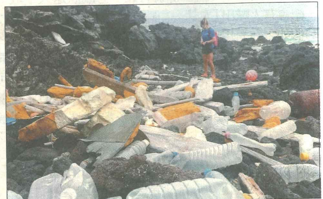
阿森松島沿海礁石上布滿塑膠垃圾。

新聞故事: 英國「倫敦動物學會」(ZSL)費時5周, 研究南大西洋的英國海外領地「阿森松島」(Ascension Island)西南海岸的數千個塑膠垃圾, 結果發現這些海漂垃圾來自中國、日本和南非等國家。