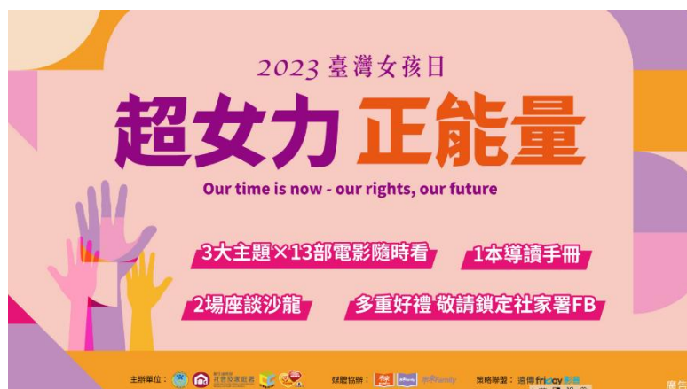
「2023 臺灣女孩日線上主題影展」