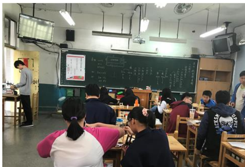
微型課桌椅-設計切割