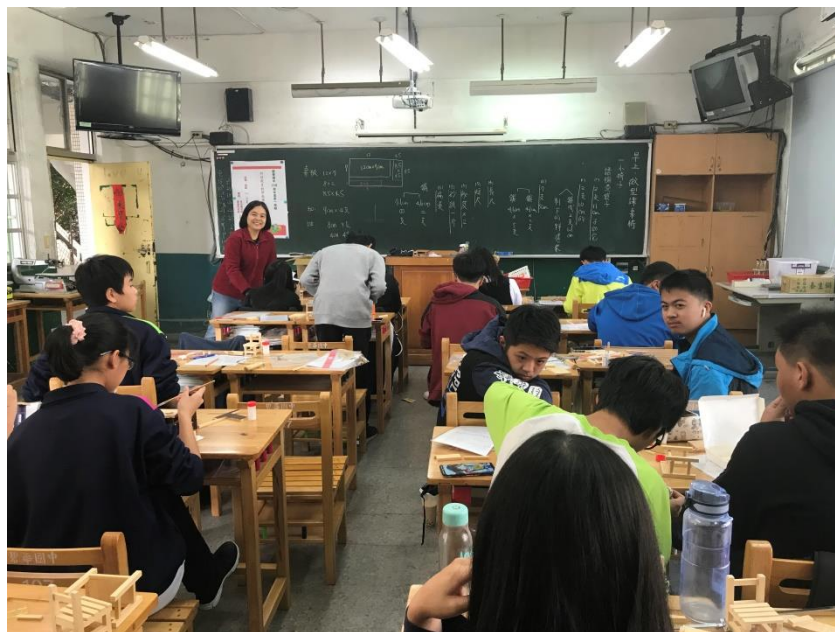
課程介紹-講師講解