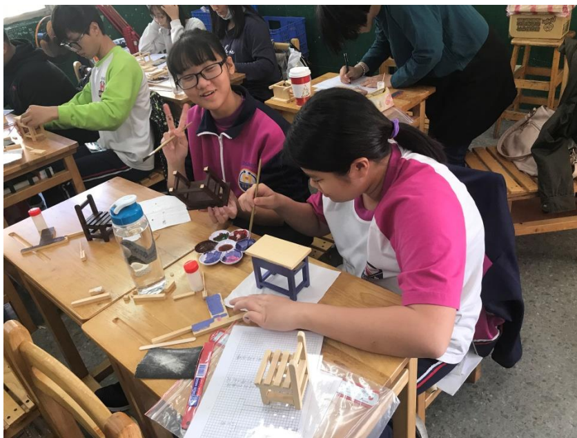
微型課桌椅-製作上色