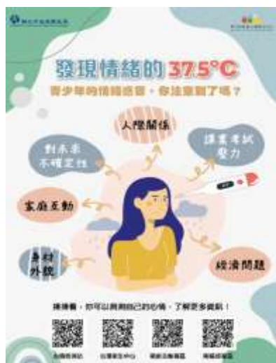
「情緒的 37.5 度 C」