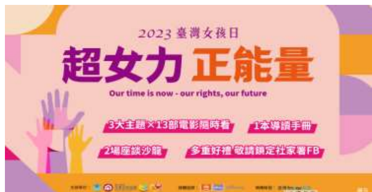
「2023 臺灣女孩日線上主題影展」