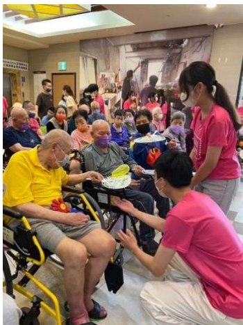
~碧風揚起共創學習~