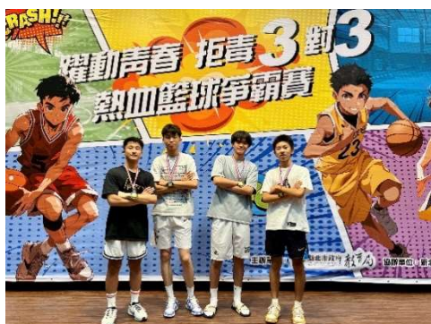
~碧風揚起共創學習~