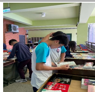
~碧風揚起共創學習~

教務處於 5/20(一)~5/24(五)每日 8:00~16:30，在 2 樓教務處外長廊，辦理「AI 來襲，你該如何學習？」的主題書展，現場展出豐富的書籍及閱讀作品，每個班級利用不同的時間，到現場翻翻實體書，感受一下閱讀的樂趣；九年級同學也趁會考結束的輕鬆時刻，好好品味一下書香，放鬆的悠遊書海。