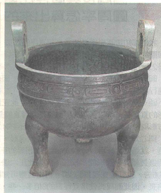
故宮新三寶——肉形石(左圖左)、翠玉白菜與毛公鼎(右圖)，因為外型討喜而走紅。

國，「故宮三寶」從此為一般民眾所知。了前車之鑑，「故宮三寶」從此斷了出國路。至於一般民眾所熟知的故宮三寶——翠玉白菜、肉形石與毛公鼎，則是因為外型親切喜走紅，但僅毛公鼎被列為國寶，翠玉白菜與肉形石的文資級別只是「重要古物」，