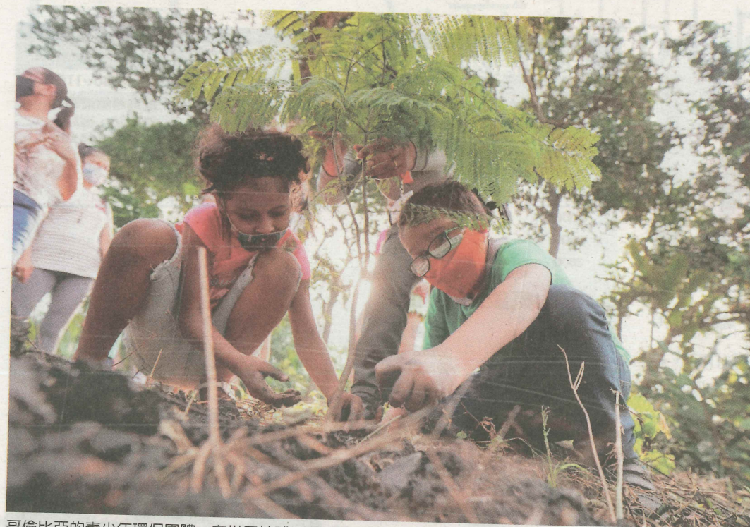
哥倫比亞的青少年環保團體，在世界地球日種樹盡心力。