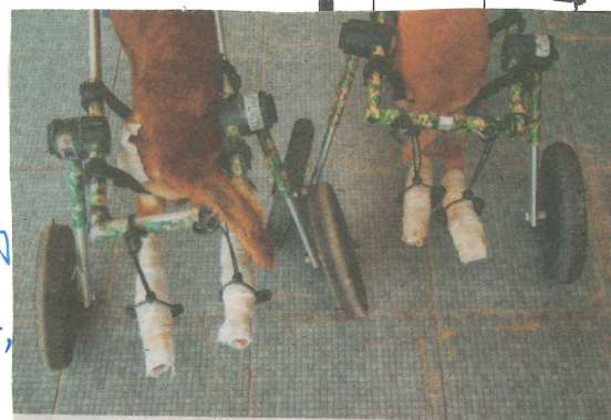
班茲從美國訂做犬隻專用的輪椅。

這些狗狗和人類中的弱勢團體很像，需要他人的幫助。但得到的幫助卻十分的少，如今有人做出了實際行動要幫助牠們，我們應該獻出自己的一份心意， 也 去幫助這些可憐的狗狗。