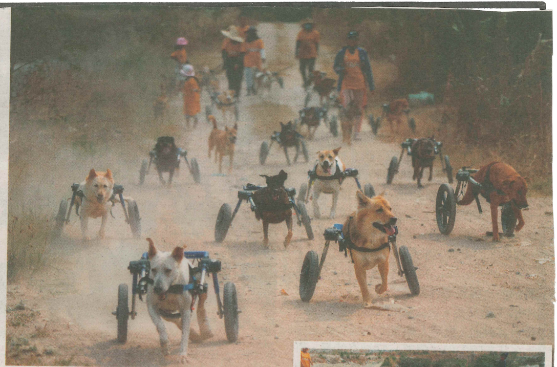
穿上輪椅裝置的狗狗可以自由奔跑(上圖)，還可以游泳(右圖)。