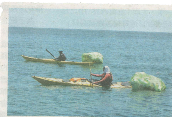
馬公師生出海時隨手淨灘，經常「滿載而歸」。

迫學生跟居民求助，認識當地聚落，了解在地人如何以海為生，體會先民怎麼胼手胝足在小島安身立命，「有感受，就有感動，才有認同」。