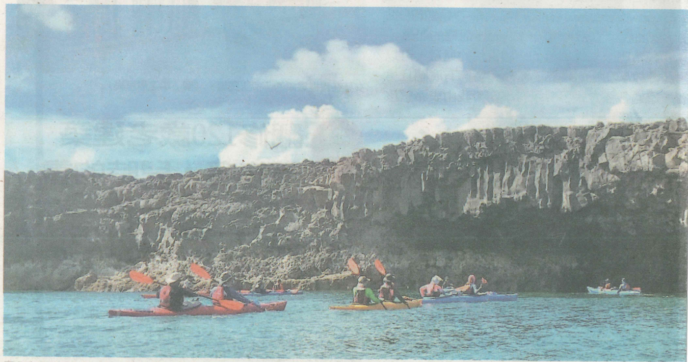
馬公高中藉獨木舟教學生認識在地，前進一般人到不了的祕境。

這篇章不僅包含海域環境，還結合環境保育，利用獨木舟來表現張祖德的毅力和決心，不僅能近距離欣賞澎湖玄武岩之美，還能友善環境，讓他們體會到「有感受，就有感動，才有認同」的信念。