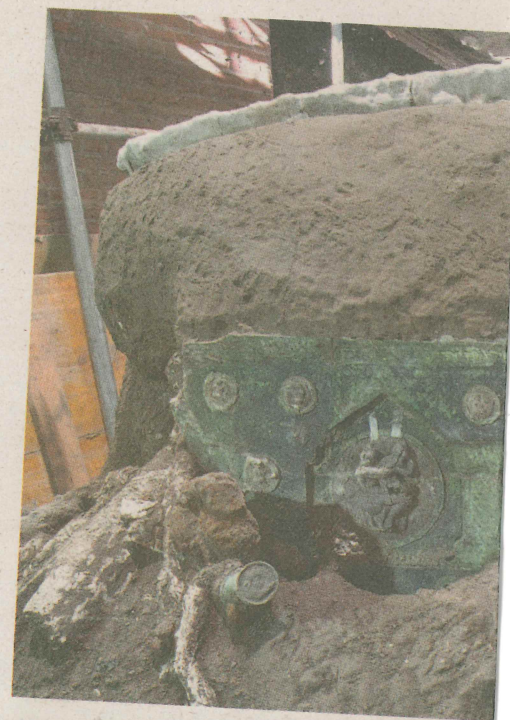
《鏡頭在義大利》 龐貝遺跡 禮車出土

的學校用品, 例如 夾、筆記本、色 品沒有庫存, 辦公 水準、外表、居住 處有最好的機會成