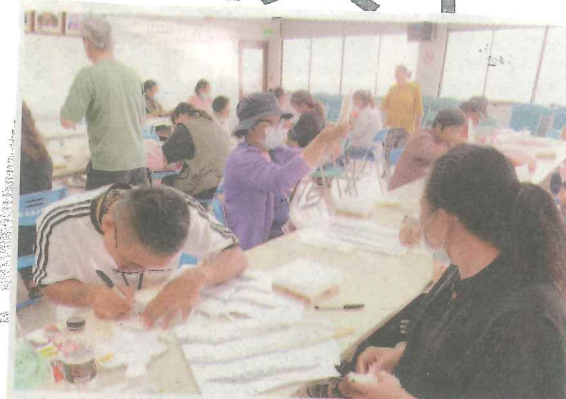
工藝師傳授仿真熊鷹羽毛的繪製技術，圖為去年到屏東縣來義鄉公所上課情況。