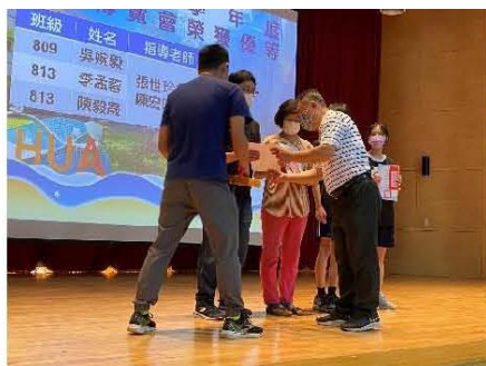
~碧風揚起共創學習~