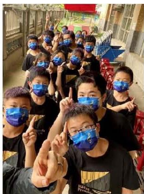
~碧風揚起共創學習~