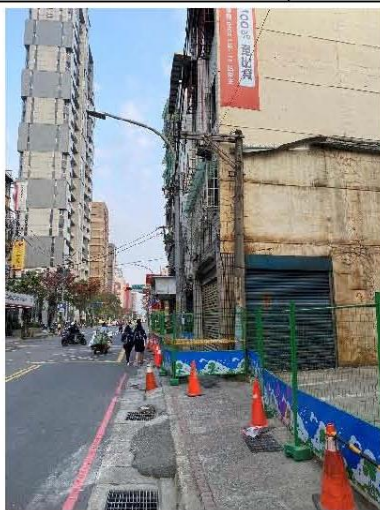
~碧風揚起共創學習~

五華街鄰近三信路口有一段住宅正進行都更拆除工程，所以請大家行經此路段務必更加小心。有騎乘腳踏車的同學，除了安全配備要齊全並遵守交通規則外，車輛停放也需要發揮公德心，請勿占用騎樓以及人行道，以免影響行人通行。